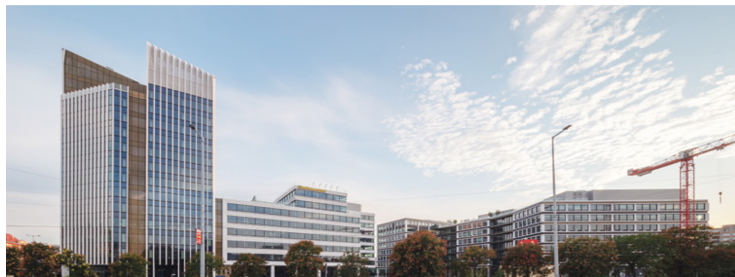
Az Agora Budapest a Váci út felé védőbástyaként magasodik fel, míg a sugaras elrendezésű, alacsonyabb hátsó traktus karéjosan védelmez, csendesebb, félig zárt teret képezve

A folyamatosan beépülő, szűkülő immár zsúfoltá vált csomóponti teret úgy igyekeztek megnövelni, hogy helyszíni félmúlti tradícióhoz igazodva a beruházók felfelé terjeszkednek